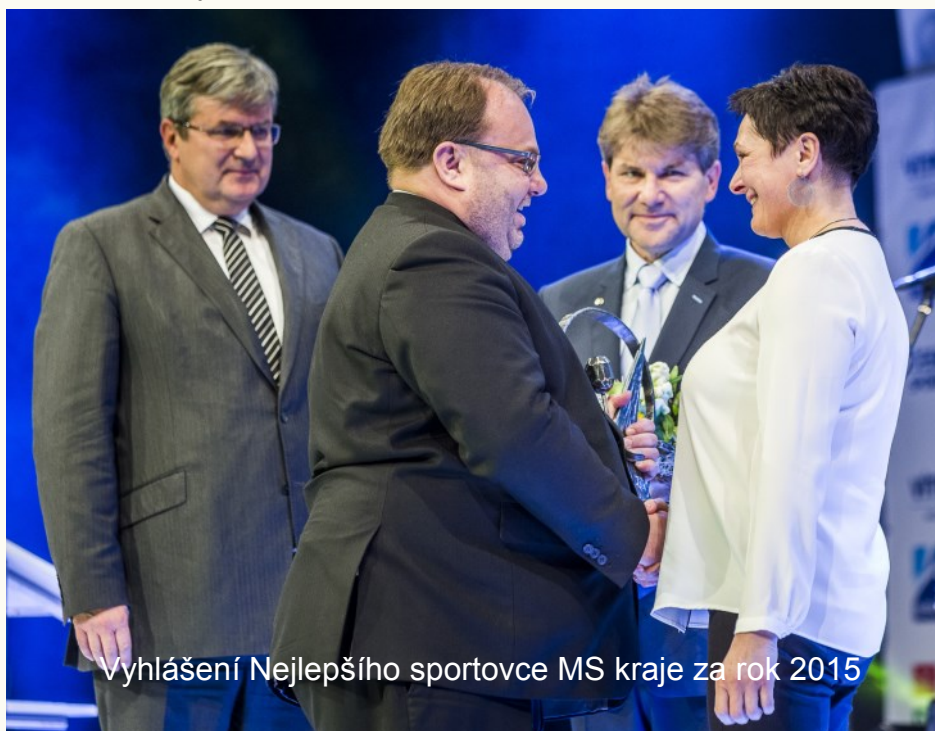
Vyhlášení Nejlepšího sportovce MS kraje za rok 2015